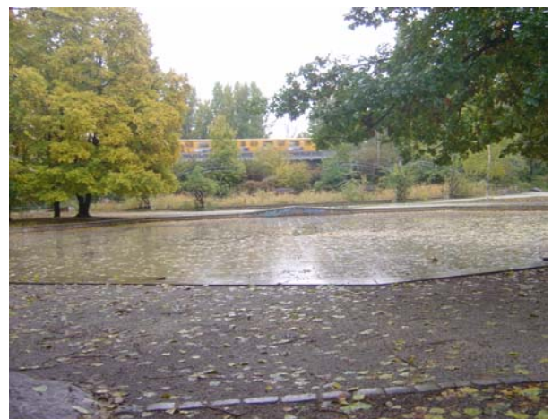
Wassertor/ Rollerskate Bahn