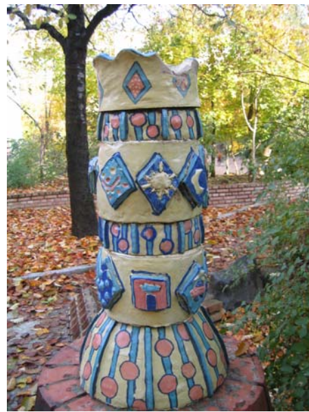
Mosaik und Ornamente in der Charlotte Salomonschule