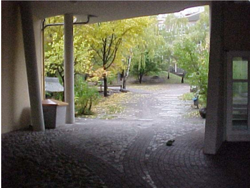
Fraenkelufer (offener Hof)

Kinder der Umgebung sollen sich an diesen Orten begegnen. Diese Orte sollen zugänglich und flexibel sein und auf die Benutzer anziehend wirken. Halböffentliche Orte wie Schule oder Kindergärten könnten dann auch solche Orte der Begegnung werden.