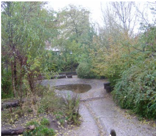
Wasser im Paulispielplatz

Imagination erfolgt durch Räume , die unterschiedlichste Spielsituationen ermöglichen und die nicht vorgeben was gespielt und wie bewegt wird, z.B. bewegtes Gelände (ist ein Garten oder ein Spielfeld), Häuser ohne Einrichtung (sind Höhlen oder Zimmer), abgegrenzte Bereiche in den verschiedensten Naturmaterialien regen die Phantasie an (Orte für Rollenspiele), Sand, Erde und Wasser ermöglichen phantasievolles Entstehen lassen (etwas Bauen, etwas bewegen, etwas verändern), Mechanische oder sich bewegende Elemente regen zum Spiel an (etwas erfinden, oder entwickeln). Und ermöglichen eigenes Gestalten und ausprobieren.