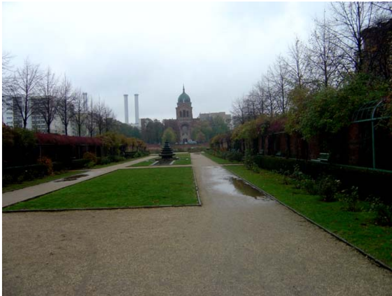
Grünstreifen am Engelbecken

Öffentlich Orte (Grünstreifen Engelbecken bis Wassertorplatz) die von den Bewohnern eines Stadtteils angenommen werden, dürfen nicht durch Auto und Verkehr dominiert werden.